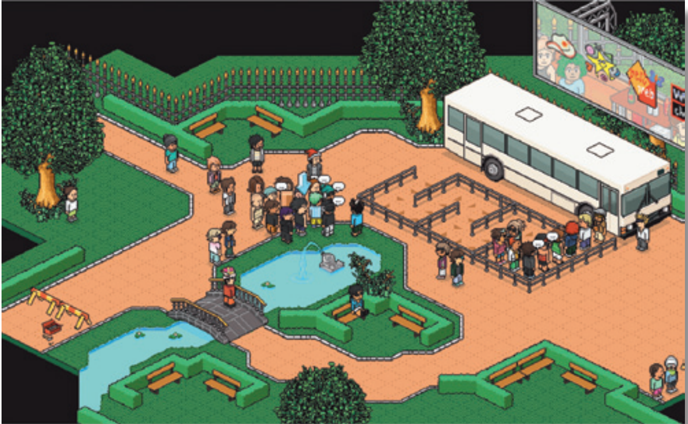
Warteschlange vor Polizeiberatungsstelle in Habbo

of Warcraft“, „Nostales“ und unzählige Weitere ausgeht, kann eindrucksvoll an folgendem Sachverhalt aus den Niederlanden dargestellt werden: Im Jahr 2010 wurde in einem öffentlichen Habbo-Hotelraum eine 11-jährige Nutzerin von einem männlichen Avatar angesprochen. Der Täter gab sich als ebenfalls minderjähriger