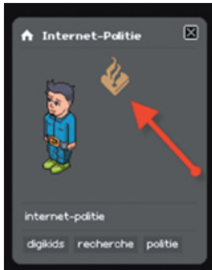
Abzeichen der Polizeiavatare

für Kinder (12 und 13) und Erwachsene gleichermaßen – freigegeben worden. Eltern wird durch diese Einstufung jedoch suggeriert, dass eine solche Welt gefahrlos